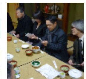
9. 今井屋さんで評判のカツ丼を