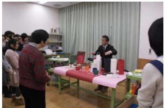
2. ペーパーによるディスプレイ春編