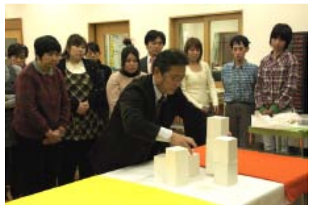
4. 布によるディスプレイ秋編